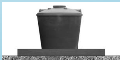
Instalación sobre superficie

Para el cálculo de la losa, consultar a un especialista.