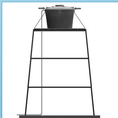
Instalación sobre torre